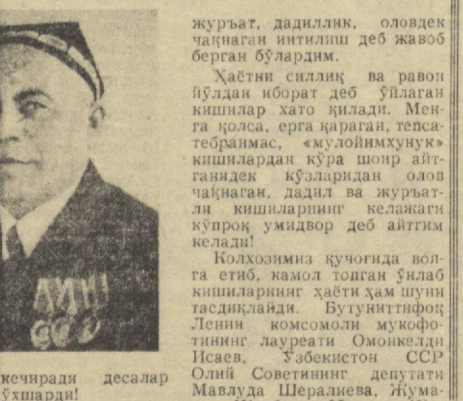
турмуш кечиради десалар афсонага ўхшарди!