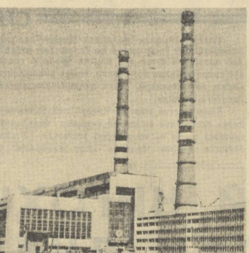
Сирдарё ГРЭСида бефта блок ишта туширишнинг республика энергетиксини риволантиришда муҳим омилга айланди...