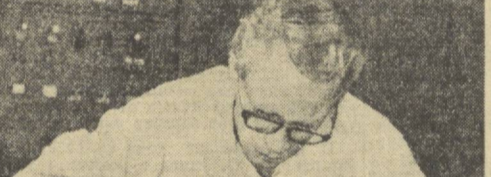
Сирдарё ГРЭСида бефта блок ишта туширишнинг республика энергетиксини риволантиришда муҳим омилга айланди...