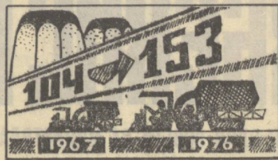
Областа пахта етиштиришнинг ўсиши (1966 йилга нисбатан процент ҳисобида)