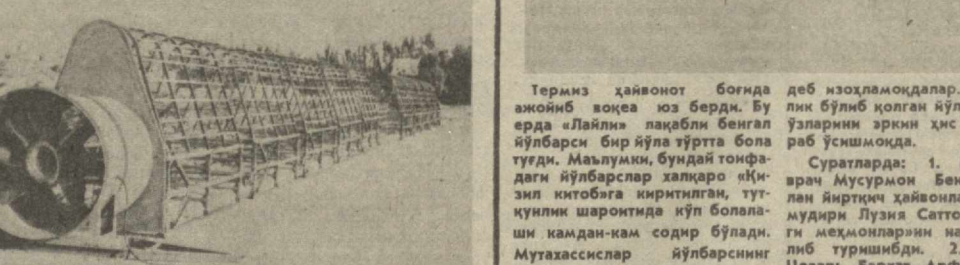
2-РАСМ. Икки вентиляцияли УВС—16 мосламасининг умумий қурилиши.

Ахборот МЕХНАТКАШЛАР ДАСТУРХОНИГА Жиззах облатида йил бошдан берн 10 га яқин хизмат кўрсатиш цехи ишга туширилиб, дастабели махсулотлар савдо тармоқларига чиқарилади. Яқинда Дўстлик районинидаги «Комсомол» совхозида ҳам кунига бир тонна қолбаса тайёрлайдиган цех фойдаланишга топширилди. Кейинчилик унинг қуввати янада оширилади.