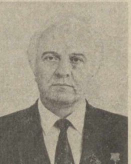
1972 йилда Грузия Компартияси Тбилиси шаҳар комитетининг биринчи секретари этиб сайланди.

Уртоқ Э. А. Шеварднадзе 1928 йилда туғилган. 1948 йилдан КПСС аъзоси. Грузия Компартияси Марказий Комитети хузуридаги ПартиясИ мактабига ва Кутаиси давлат педагогика институтини тамомлаган.