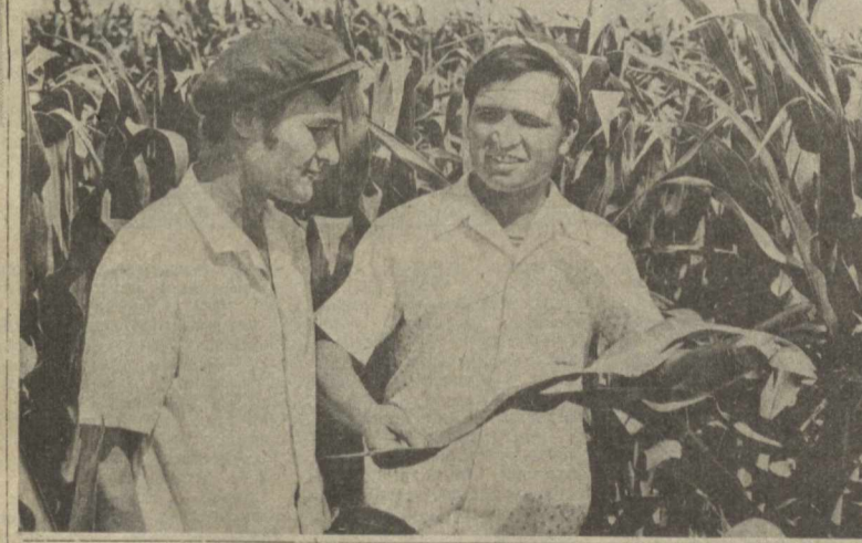
Сўз — МИРИШКОРЛАРГА

Самолетга ортилган ноз-неъматлар Республикамизда айни йилининг ССРС Олий оқиёт программасини амалга оширишга ўз ҳиссаларини қўшишга ҳаракат қилаётган соҳибдорлар пишиб етилган мева ва сабзавот маҳсулотларини тайёрлаш пунктлари ҳамда савдо шохобчаларига пешма-пеша етказиб беришмоқда.