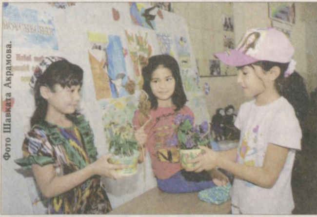
В списке дневных лагерей, организованных в столице, наткнулась на совпадение - оказалось, что два из них в разных районах называются одинаково - "Орзу", то есть "Мечта". На вопрос о том, почему выбрали именно такое название, в одном из них ответили: "Во-первых, потому что лето - это время радости и надежды, а еще потому, что мечтать тоже нужно учиться".