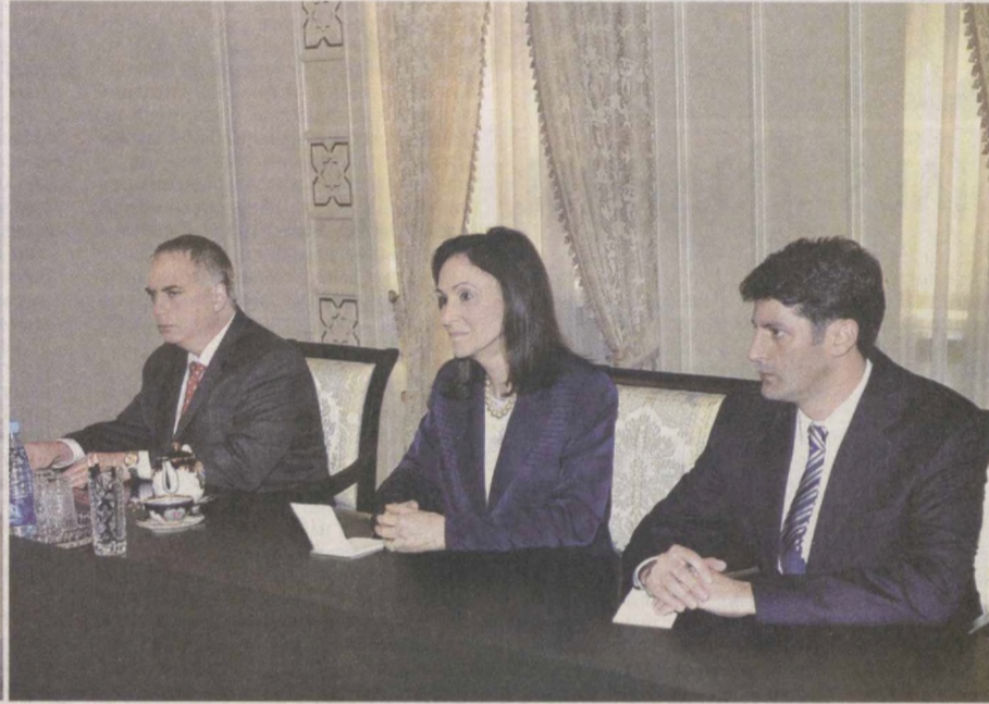
Президент Республики Узбекистан Ислам Каримов 17 августа в резиденции Оксарой принял делегацию деловых кругов США во главе с председателем Американско-Узбекской Торговой палаты Кэролин Лэмми.

Приветствуя гостей, глава нашего государства отметил последовательное расширение деловых связей между ведущими компаниями двух стран и охарактеризовал как положительный факт успешное проведение бизнес-форума, организованного Американско-Узбекской Торговой палатой, в котором приняли участие около 80 бизнесменов США из числа руководителей 25 ведущих американских компаний, большая часть из них является транснациональными.