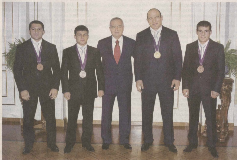
Президент Республики Узбекистан Ислам Каримов 24 августа в резиденции Оксарой принял спортсменов нашей страны, завоевавших медали на XXX летних Олимпийских играх в Лондоне, и их тренеров.

- Сегодня мы собрались для чествования и награждения спортсменов, достойно защитивших честь нашей страны на XXX летних Олимпийских играх в Лондоне, - сказал глава нашего государства. - В мире проводится большое количество международных спортивных соревнований самого высокого уровня. Но без всякого преувеличения можно сказать - самыми значительными в мировом спорте являются Олимпийские игры, проводимые раз в четыре года. Поэтому для каждого спортсмена участие в Олимпийских играх - великая честь. В этой связи с большим удовлетворением хочу выразить глубокую признательность юношам и де-