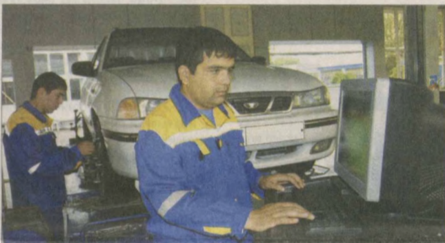
Еще один шанс выпускникам предоставил конкурс "Еш тадбиркор - юртта мадалкор", организованный Центральным Кенгашем ОДМ "Камолот", Торгово-промышленной палатой Узбекистана и ОАКБ "Микрокредитбанк".

Очередная концертная программа в целях укрепления дружеских и культурно-просветительских связей между узбекским и японским народами была показана в Бухаре. На мероприятии, прошедшем в Бухарском колледже искусств, министр по делам культуры и спорта Республики Узбекистан Т.Кузиев и другие отметили, что подобные музыкальные форумы способствуют дальнейшему развитию культурных связей между нашими странами. Бухарец очаровало мастерство известных японских исполнителей. Вместе с тем узбекские национальные песни привлекли внимание японских гостей представил творческий коллектив колледжа. Кульминацией концертной программы стало совместное исполнение бухарскими и японскими артистами произведения композитора Гакужиндзана Хасимото "11 марта 2011 года". - Этот концерт в очередной раз убедил меня, что искусство, музыка способны объединять страны, - говорит специалист по пошиву национальной одежды из Токио Сачико Вакизака. - Мы разговариваем на разных языках, но взгляды и музыкальное видение наших народов очень близки. Меня покорили узбекские музыканты, исполнявшие японскую музыку.