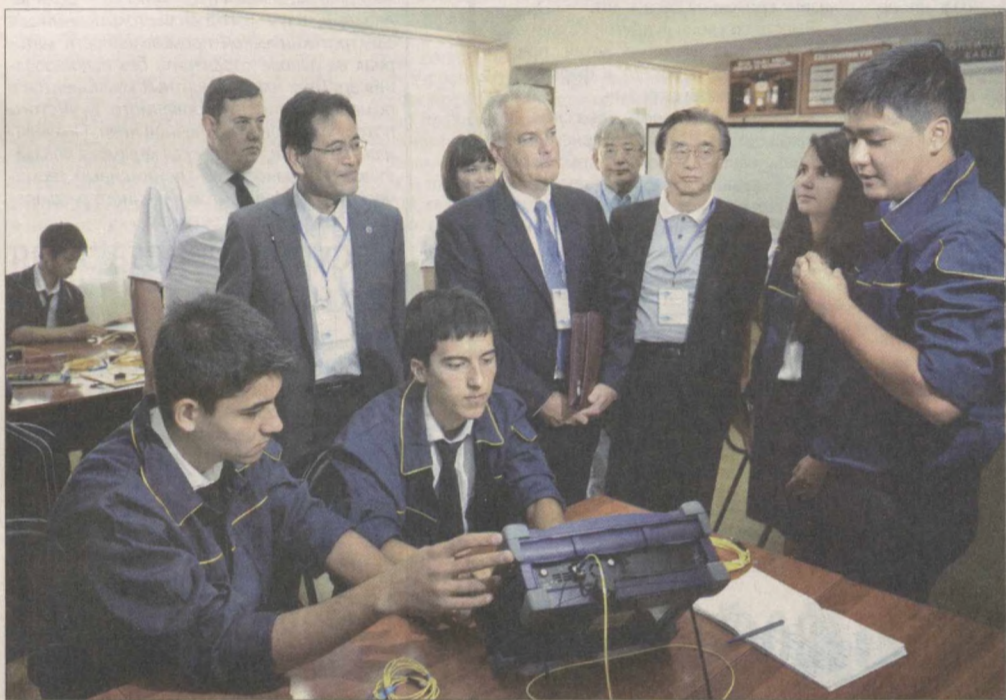
Участники международной конференции "О роли и значении малого бизнеса и частного предпринимательства в реализации социально-экономической политики в Узбекистане", организованной по инициативе Президента Ислама Каримова, 13 сентября ознакомились с осуществляемой в Ташкенте и Бухаре широкомасштабной работой по развитию малого бизнеса и частного предпринимательства, посетили средние специальные, профессиональные учебные заведения, а также совершили экскурсии по историческим, архитектурным и культурным объектам.