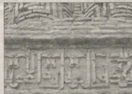
Фрагмент Джаркурганского минарета (1108-1110 гг.).

- Именно. Исследования значительного числа памятников показали: ко времени пере-