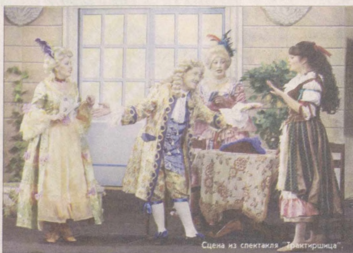
Сцена из спектакля "Трактиришица"

курсы, открывшиеся при Государственном институте искусств. Хорошей школой стала и стажировка в Молодежном театре Узбекистана.