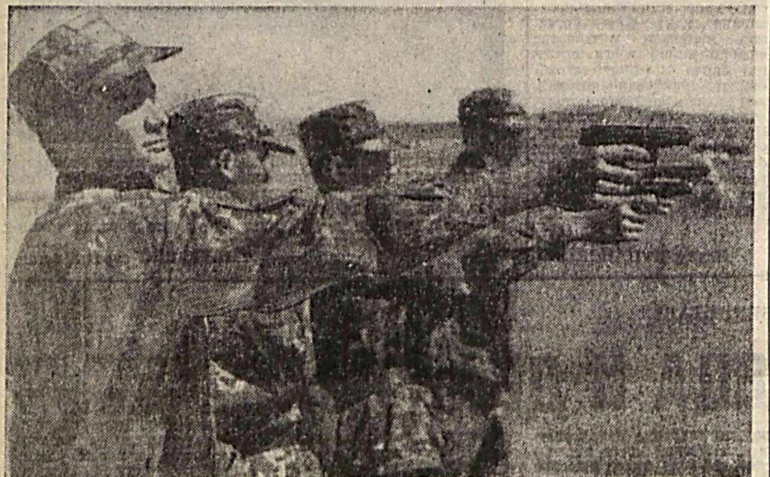
Стрельба из стрелкового оружия — важный элемент подготовки будущих офицеров запаса. Большинство студентов, проходящих полевые сборы, впервые взяли в руки боевое оружие. Тщательная подготовка к занятию, настрой на отличный результат приносит свои плоды. Большинство обучаемых покидают огневой рубеж с высокими оценками.