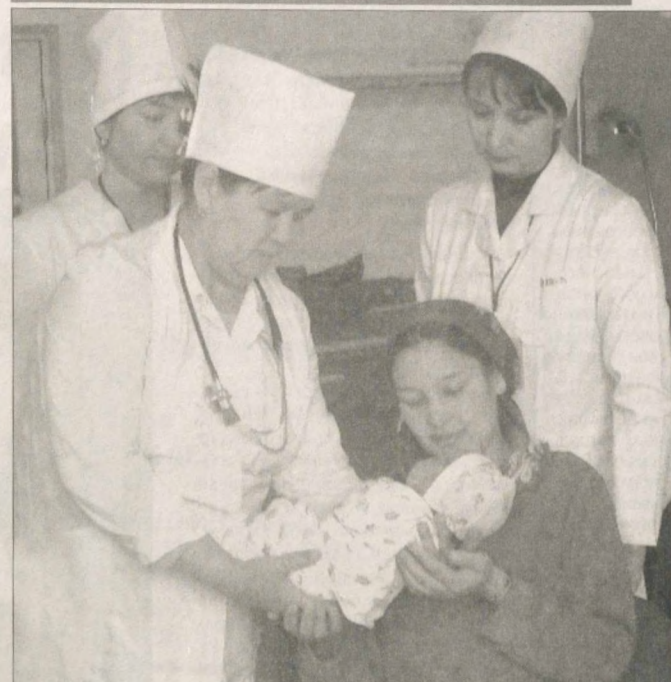
В Пайарькском районе реконструировано здание медицинского объединения.