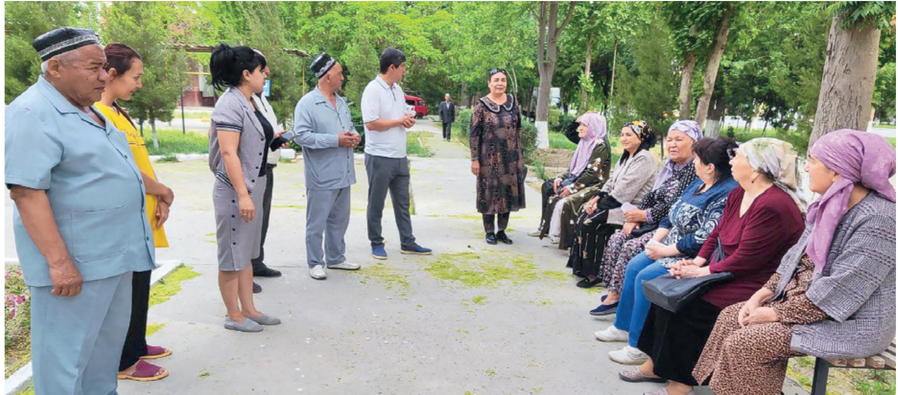
2021 йилда ҳудудда 17 та ажралиш қайд этилган бўлса, бу кўрсаткич 2022 йилда 7 тани ташкил этди. 2023 йилда 5 тага тушди. 2024 йил ҳали бу масалага дуч келмадик.