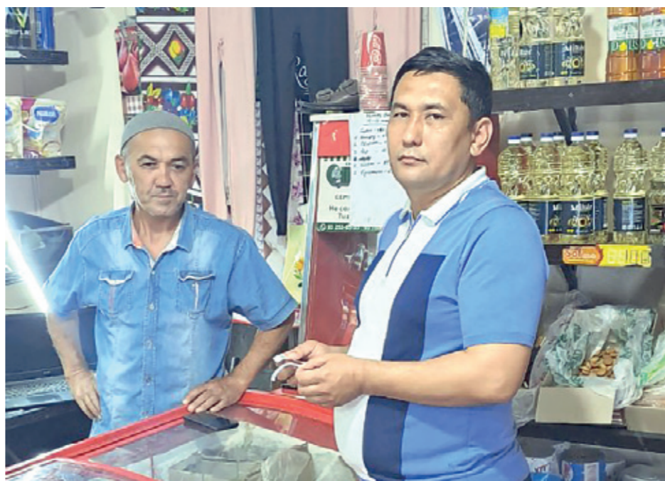
СОЛИҚЧИ – ҚўМАҚЧИ