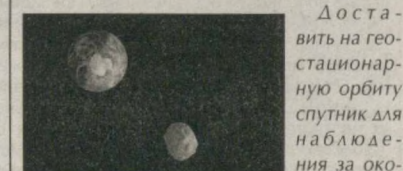
Доставить на геостационарную орбиту спутник для наблюдения за околоземными объектами должна индийская ракета-носитель, которая будет запущена с космодрома Шрихарикота, расположенного на одноименном острове в Бенгальском заливе. НЕОСат - это не только первый канадский космический телескоп, но и первый в мире телескоп, специально сконструированный для обнаружения и отслеживания с орбиты астероидов. Совершая виток вокруг Земли за 100 минут, он будет производить сканирование космического пространства близ Солнца с целью засечь те астероиды, которые практически невозможно найти сейчас другими средствами. Это значительно улучшит возможности по наблюдению за космическими объектами, которые могут представлять угрозу для Земли. Спутник также способен отслеживать ситуацию с орбитальным "мусором", и в этом будет заключаться его вторая задача.

Канада запустит в космос первый в мире орбитальный телескоп для отслеживания астероидов.