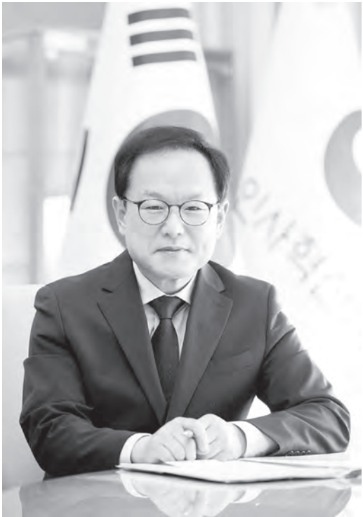
Ким Сын Хо. Министр управления персоналом Республики Корея.