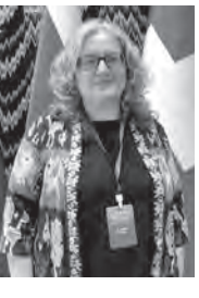
Сунджид ДУГАР, главный представитель Национальной комиссии по правам человека Монголии