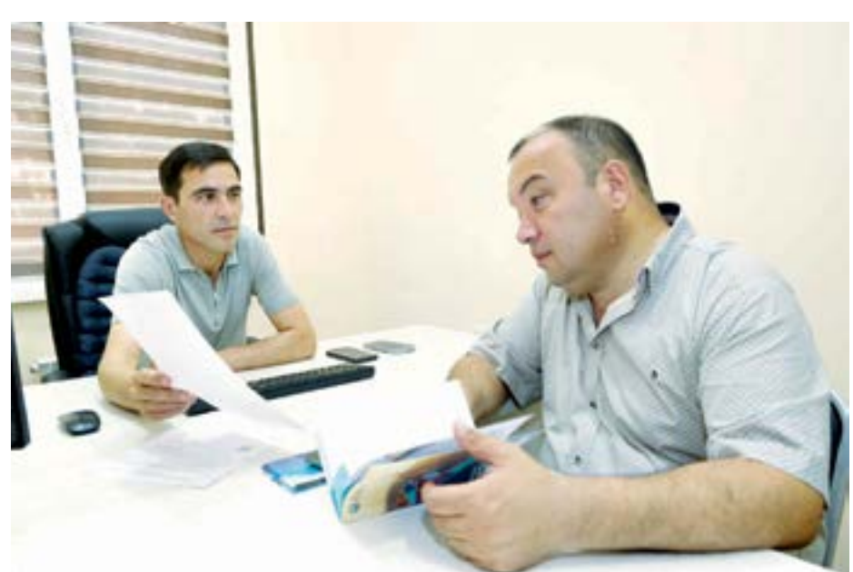
жамоалар ўртасида қизгин баҳс бораётганди. Танафус бўлиши билан болаларни суҳбатга чорлади.

Ҳозир мамлакатимиз бўйича 14 та футбол академияси фаолият юртияпти. Тошкент шаҳри футбол академияси улардан бири. Ушбу дароҳ бундан икки йил аввал реконструкция қилиниб, замонавий воситалар билан жиҳозланган эди. Футбол академиясига кириб борганимизда стадионда