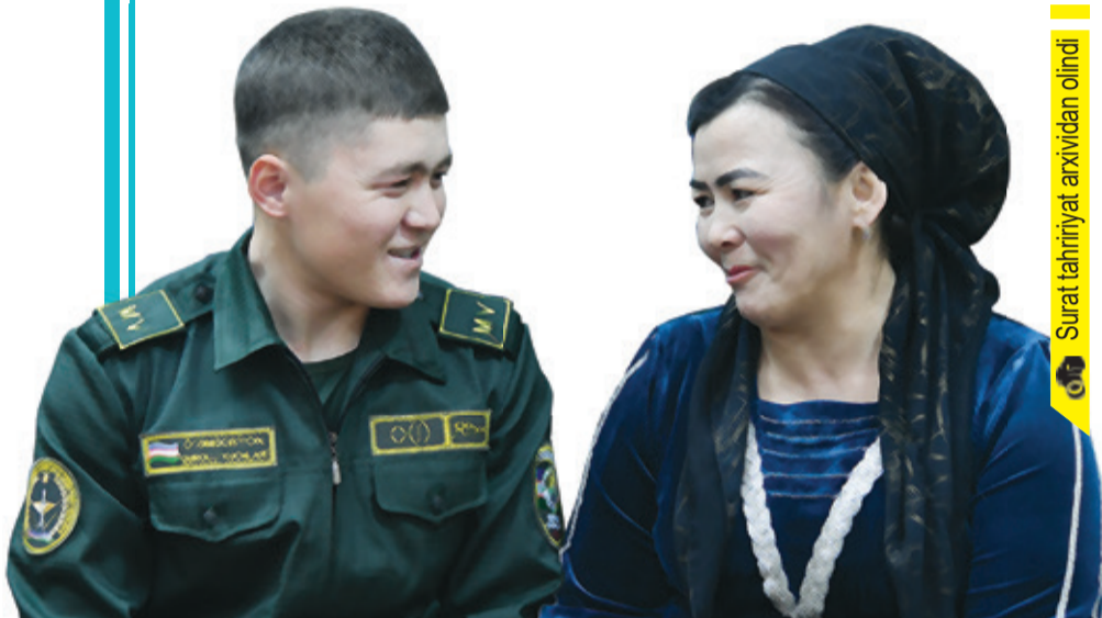
Surat tahririyat arxividan olindi

Hayotimda ilk bor o'zim uchun vaqt ajratdim. Ta'tilda Jizzax viloyatining Zomin tumanida joylashgan "Azim Zomin shifo" sanatoriysida dam oldim. Tog' etagida joylashgan muassasaning ta'rifiga til o'jiz. Bahorning so'nggi oyida bu yerlar yanada yashnab ketar ekan. Jiyda gullari ifori ochiq derazalardan xonalarga ham kirib keladi. Balkondan tashqariga boqsangiz, olis-olislardan archazor tepaliklar ko'zingizni quvontiradi.