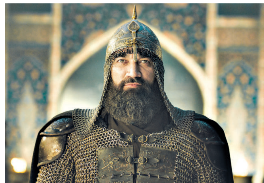
Хатой Баҳодир бўлган. Айрим манбаларда унинг исми гоҳ Низомиддин, гоҳ Абдулқарим тарзида келтирилади. Ривоятларга кўра, душманга қарши бир жангда ҳеч қандай совуטים,

қалқонсиз, кўксини очиб майдонга тушгани учун унга Ялангтўш лақаби берилган. Давлат бошқарувини қўлга киритишга ҳисса қўшгани, садоқатли ва намунали хизматларини эътиборга олган Имомқўлихон 1612 йили Баҳодир Ялангтўшни Самарқанд вилояти ҳокими этиб тайинлайди. Бир неча танаффус билан у қирқ йил Самарқандни бошқарган.