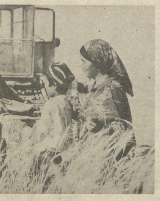
Республика комитети 15 июндан 15 августгача зарбдор ойлик эълон қилдилар. Шу давр мобайнида барча терим техникаси ремонтдан чиқарилиб, старт чизилди-рига қўйилиши керак.

Шу мақсадда ҳар бир колхоз, совхоз ва «Госкомсельхозтехника» район бирлашмаларида терим техникаси ремонтини ўз вақтида, сифатли ўтказиш борасида аниқ тадбирлар белгиланмоғи, оператив штаблар ташкил этилиши ва тасдиқланиши, етарли миқдорда механизаторлар жалб қилинган ремонт бригадалари тўзилиши, терим-транспорт отрядларини ташкил этиш тугалланиши, механизаторлар сонини аниқланиши, агар лозим бўлса механик-ҳайдовчилар тайёрлаш курслари очилиши лозим.