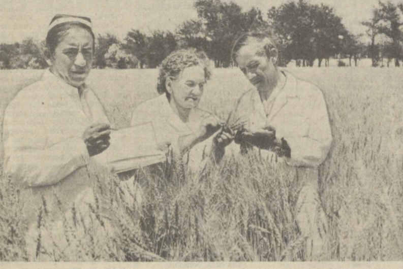
Янги нав буғдой