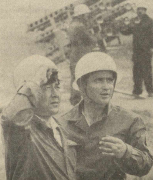
Айтайлик, Самарқанд районидекхонлари икки йилгадан бери экинларимизни дўл уриб кетади деб ўйлашмайди ҳам. Негаки, Ўзбекистон гидрометеорология ва табиий муҳитни назорат қилиш республика бошқармасининг бу ердаги дўлга қарши кураш отряди 80 минг гектардан ортиқ экин майдонини ўз муҳофазасига олган.

Фан-техника тараққийнинг жадаллашиб бориши инсоннинг табияти ўз изинга бўйсундиришда зўр омиллар. Илмий тасвирлар ва энг янги техника билан қуролланиш нисомига шундай кудрат бердики, эндиликда табиий офатлар ҳам унга писанд эмас.