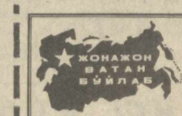
ЖОНАХОН БАҲОН БЎЙЛАВ

● ПЕТРОПАВЛОВСК—КАМАЧАТСК. Камчаткадаги В. И. Ленин номи энг йирки балчилик колхоз деғизчи-лар ҳақида яратилган энг ахши ёсарлар учун адабий мукофот таъсис этиди. Бу мукофот Балчилик кўни шарафига шoir Э. Қуни билан адаб В. Варнога берилди. Эмил Қуни кўп йиллар мобайнида колхоз посткасидаги ўрта мактабда раб беради, кейин эса деғизчилик билми юрти-да балки ошлаб флотин учун кадрлар тайёрлаш билан шуғулланди. Унинг бир қанча асарлари, шулар қатори мукофот билан тақдирланган «Зангорн қўзин қиз» поэмаи шу машаққатли кесб киймларига бағишланган. Владимир Варнонинг «Балчилик орасида қанча таъзимамиз бор» китоби балчилик билан адабтичи-ларнинг юксак баҳосига сазовор бўлди. Китоб қаҳрамонларининг прототиплари Камчаткадаги колхоз аъзолари дир.