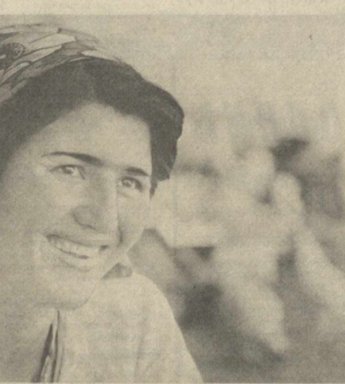
Оқдарё район матдубот жамиятига қарашли ёрдмичи хўжаликда паррандалар махсулдорлиги йил сайни орти ёрмоқда. Паррандабоқарлар бу муваффақиятга озуқа базасини мустаҳкамлаб, парваршида илм-фан ютуқларини ва прогрессив технологидан кенг фойдаланаётганликлари туфайли эришмоқдалар.

Кеча программаси хилма-хил бўлди: жаҳон халқларининг қўшиқ ва рақслари, қардош республикалар ва Афғонистон композиторларининг асарлари ижро этилди.