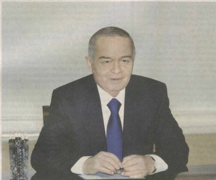
Президент Республики Узбекистан Ислам Каримов 18 декабря в резиденции Оксарой принял министра иностранных дел Российской Федерации Сергея Лаврова.

В ходе беседы были рассмотрены состояние и перспективы многопланового узбекско-российского сотрудничества, актуальные международные и региональные проблемы, затрагивающие интересы обеих стран.