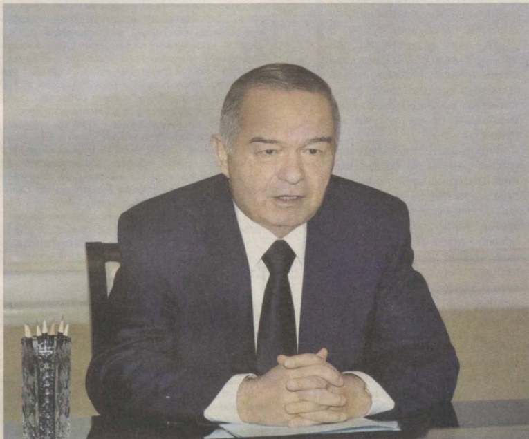
Президент Республики Узбекистан Ислам Каримов 21 декабря в резиденции Оксарой принял Премьер-министра Республики Казахстан Серика Ахметова.

Приветствуя гостя, глава нашего государства отметил, что сотрудничество с Казахстаном всегда было и остается для Узбекистана приоритетным. Для Узбекистана Казахстан является надежным, проверенным временем партнером и близким соседом.