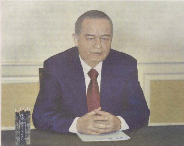
Президент Республики Узбекистан Ислам Каримов 29 марта в резиденции Оксарой принял Верховного комиссара ОБСЕ по делам национальных меньшинств Кнута Воллебека.

Глава нашего государства высоко оценил проявляемое К.Воллебеком внимание к актуальным вопросам межэтнических отношений в Центральной Азии и подчеркнул важную роль Верховного комиссара ОБСЕ по делам наци-