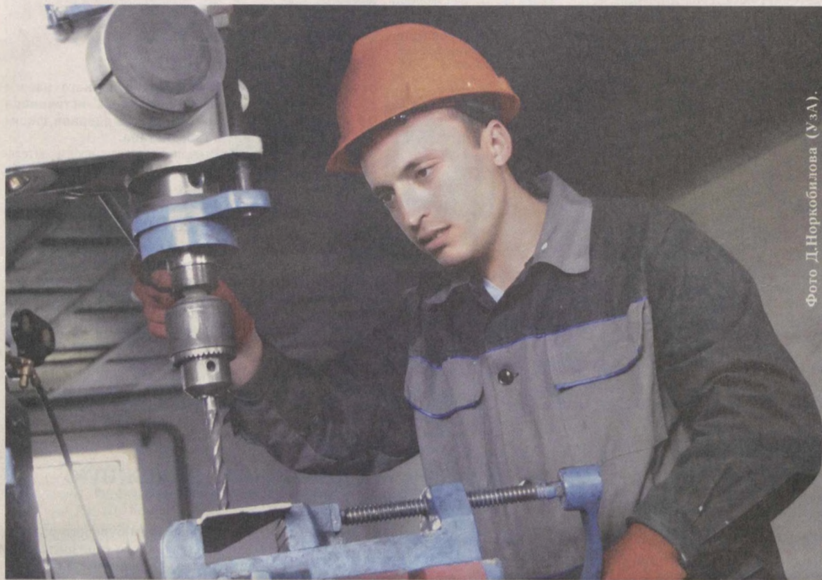
Фото Д.Норкobilова (УзА).

Общество с ограниченной ответственностью "Тегиримонмонтажсервис", действующее в Китабском районе Кашкадарьинской области, специализировано на производстве и монтаже запчастей для мельниц.