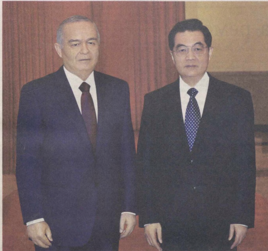
Пекин, 19 апреля. Передает спецкор УзА Анвар БАБАЕВ.

Президент Республики Узбекистан Ислам Каримов по приглашению Председателя Китайской Народной Республики Ху Цзиньтао 19 апреля прибыл с государственным визитом в Пекин.