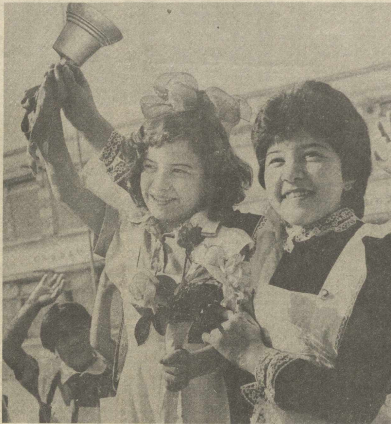
Биринчи қўнғирқоқ шодибаси.