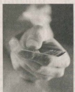
Банкомат и 59 инфокиосков. Новые карточки Ипотечная банка применяются в качестве оплаты почти на всех торгово-сервисных предприятиях, среди которых кафе, аптеки, автозаправки, авиационные и железнодорожные кассы и другие.

В связи с увеличением количества клиентов, пользующихся пластиковыми карточками, выделяются немалые средства на развитие инфраструктуры по их обслуживанию. В торговых сервисных пунктах, сберегательных и коммунальных кассах установлено свыше семи тысяч терминалов, а также 16