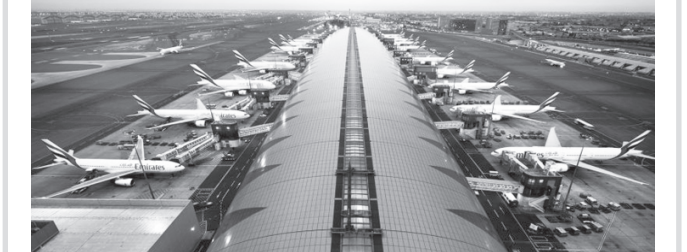
Ўтган йилда халқаро рейслар бўйича энг кўп йўловчилар ҳамда юкларни қабул қилган аэропортлар номи эълон қилинди.

Унга кўра, Бирлашган Араб Амирикларидаги Дубай халқаро аэроporti 77,5 миллион нафар кишига хизмат кўрсатиб, биринчи ўринни эгаллади.