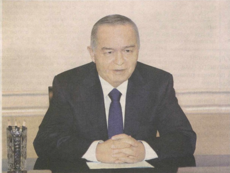
Президент Республики Узбекистан Ислам Каримов 5 апреля в резиденции Оксарой принял министра иностранных дел Российской Федерации Сергея Лаврова, находящегося в Ташкенте в связи с участием в очередном заседании Совета министров иностранных дел СНГ.

Глава нашего государства, тепло приветствуя гостя, отметил, что узбекская сторона высоко ценит достигнутый уровень стратегического партнерства и союзничества между нашими странами, позволяющий последовательно реализовывать имеющийся значительный потенциал взаимовыгодных и равноправных отношений в различных областях.