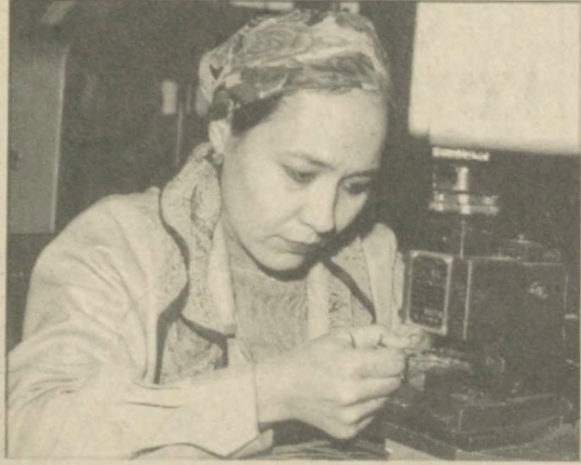
Вот уже второй год успешно работает в городе Хонабаде Анджаханской области узбекско-корейское предприятие «УзКоджи». Главная его продукция - жгуты и электрические провода для автомобилей производства СП «УДЗУАУ».

Назира Шабанова. Соб.кorr. «Правды Востока».