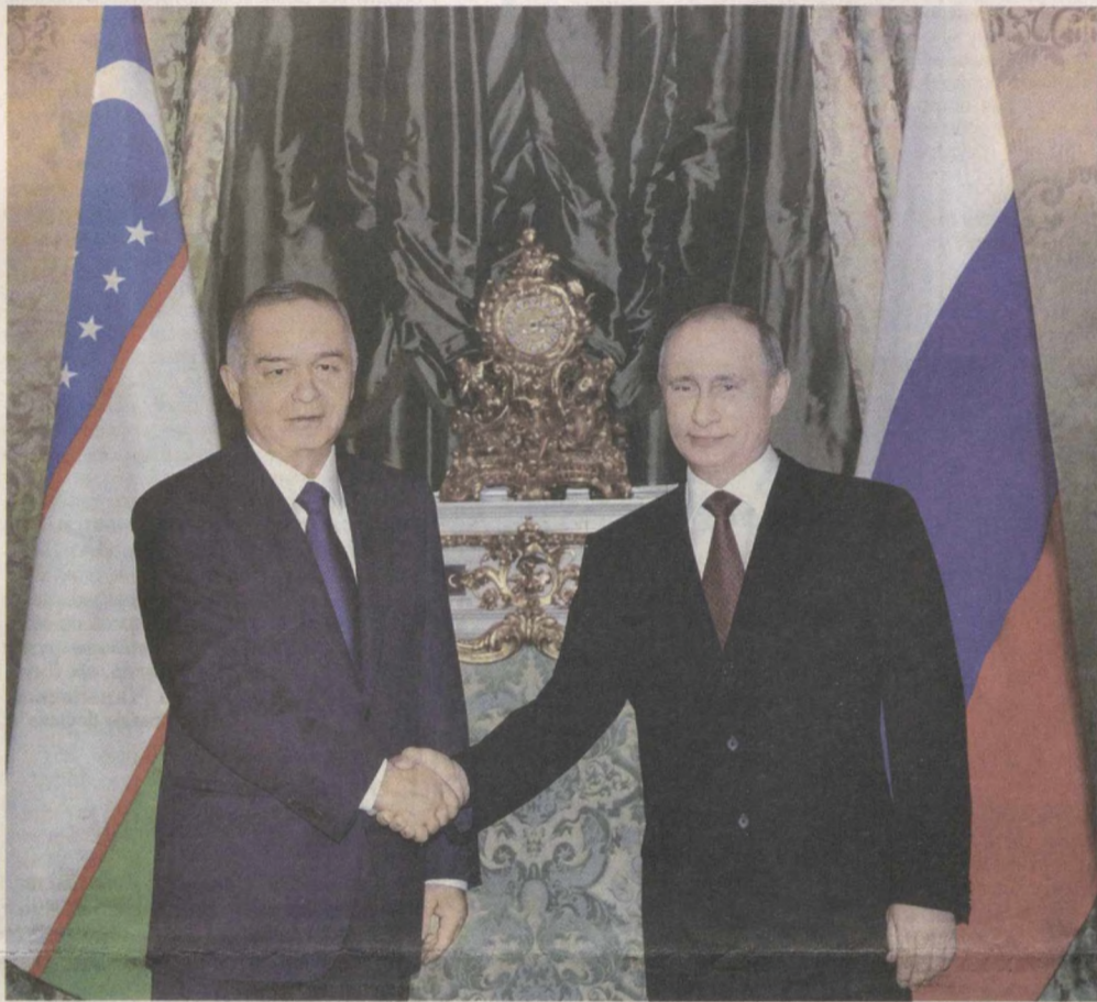
Как ранее сообщалось, Президент Республики Узбекистан Ислам Каримов по приглашению Президента Российской Федерации Владимира Путина 14-15 апреля посетил с официальным визитом эту страну.

Политический диалог на высшем уровне в отношениях Узбекистана и России носит регулярный характер. В апреле 2010 года Ислам Каримов посетил Россию с официальным визитом. Владимир Путин в июне 2012 года находился в Узбекистане с официальным визитом, по итогам которого в числе других документов была подписана Декларация об углублении стратегического партнерства между Республикой Узбекистан и Российской Федерацией.