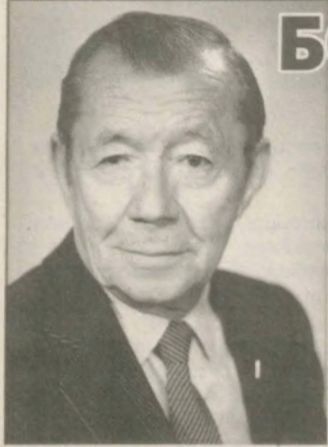
Десять лет назад ушел из жизни замечательный актер театра и кино, народный артист, лауреат двух государственных премий Наби Рахимов. Президентским указом в минувшем году он посмертно удостоен ордена "Буюк хизматлар учун".

Наби Рахимов родился в древнем Коканде, который славится как город, давший миру плеяду поэтов, прозаиков, художников и артистов. Видимо, аура искусства наложила свой отпечаток на юного Наби. Его отец был мастером на все руки - чинил замки и керосинки, плыл ведра, восстанавливал нехитрую домашнюю посуду и утварь. Помогая отцу, сын всю работу выполнял играючи, напевая мелодии, услышанные от матери или на свадьбах.