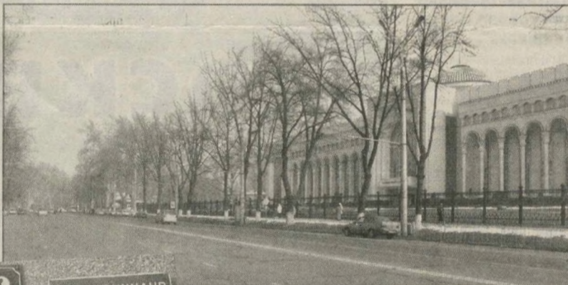
6 MOVAROUNNAH KOCHAS