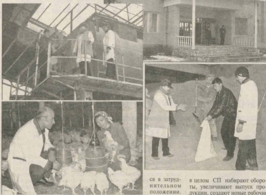
НА СНИМКАХ: на предприятии "Голден винг" выращивается птица.

рез 35 дней. Сегодня эта картина вновь повторяется, деньги СП лежат в банке без движения. Своевременно неконвертируемые средства СП подымают его доверие перед партнерами в Турции, где закупается по-прежнему сырье, различные лекарства для птицы. Тем более, что предприятие и так находит-