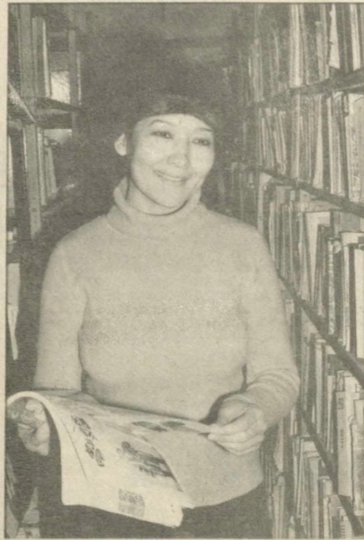
На ней представлены интересные книги, отражающие историю города.