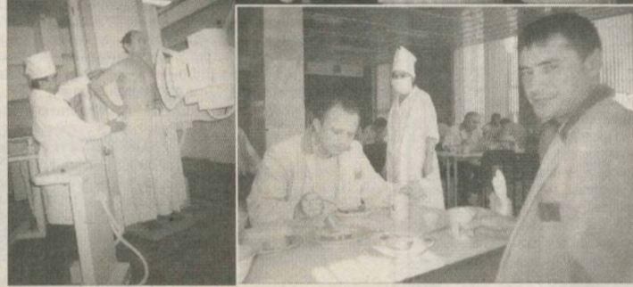
В ЦИПе одновременно лечатся 60 человек. Палаты одно- и двухместные, с душевыми и туалетами. Зимой в них тепло и уютно, а летом прохладно - подается кондиционированный воздух