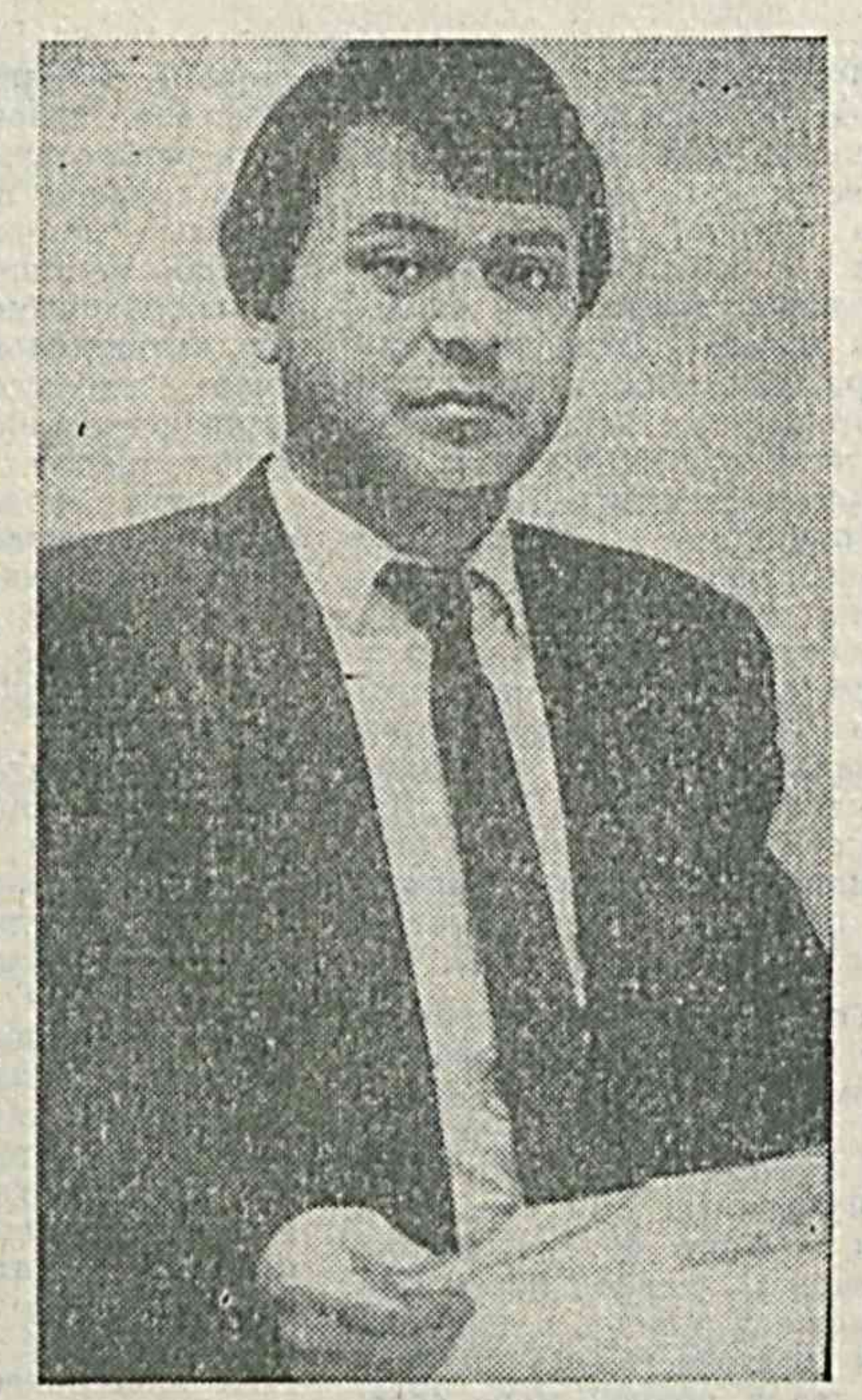
Бизам, ўша ёшларда кўрган, эшитган, ўзим тухови бўлган воқеалар ҳақида ҳикоя қиламан...