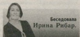
Беседовала Ирина Рибар.

- Сегодня музеи активно участвуют в жизни общества, стремятся к тому, чтобы вносить свой вклад в его социальное, культурное и духовное развитие. Конечно, мы всегда должны помнить, что работаем прежде всего для своих соотечественников, воспитывать в обществе гордость и уважение к своим корням. В свою очередь они должны стараться быть до-