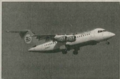
Самолет RJ-85 (3 шт.)

А также продолжается программа реализации авиационной техники типа ТУ-154М, ТУ-154Б, ИЛ-76ТД, ЯК-40 и соответствующих авиадвигателей.