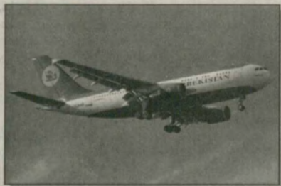
Самолет пассажирский А310 трехклассной компоновки (3 шт.)

В связи с унификацией самолето-моторного парка Национальная авиакомпания «Узбекистон хаво йуллари» предлагает к продаже авиационную технику