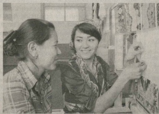
сумов - в десять раз больше, чем в прошлом году.

Не остаются без внимания и вопросы привития предпринимательских навыков молодежи. Финансовая поддержка выпускников колледжей помогает им либо продолжить образование, либо создать свой малый бизнес. Последний вариант помогает обеспечить их достойными рабочими местами. В этом году филиал банка на эти цели выдал 100 миллионов