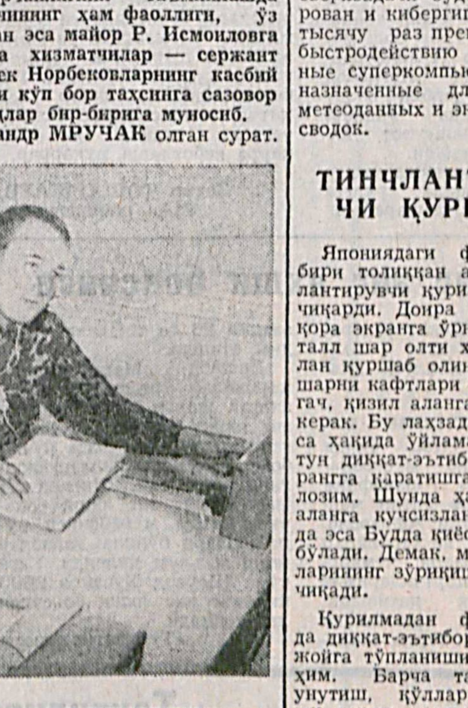
«Оммавий ватанпарварлик тадбирлари олдига мусобабот билан ҳарбий қисмимизда кўп тадбирлар, уюмлар, уюмлар бўлиб ўтмоқда...