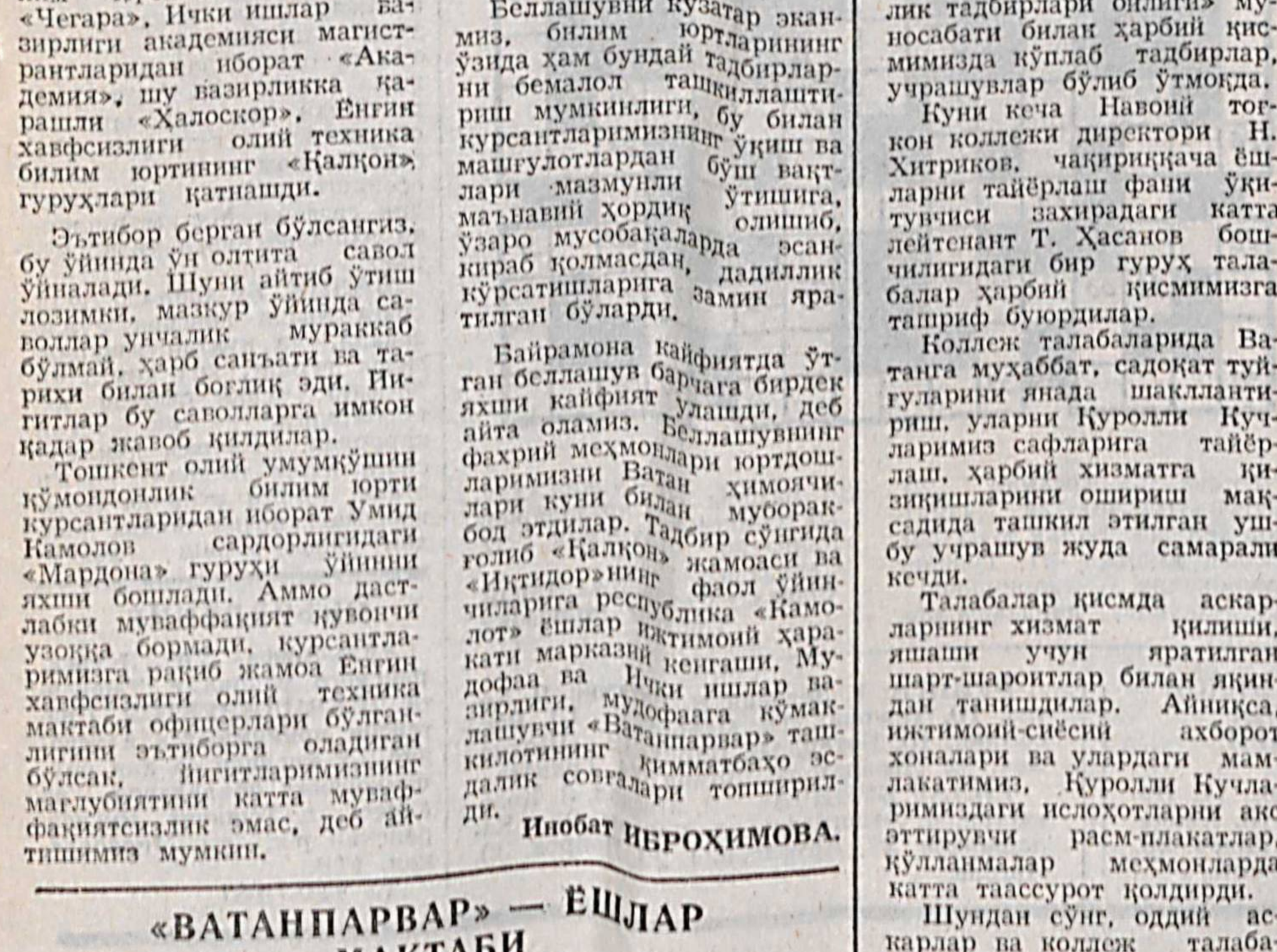
«Оммавий ватанпарварлик тадбирлари олдига мусобабот билан ҳарбий қисмимизда кўп тадбирлар, уюмлар, уюмлар бўлиб ўтмоқда...