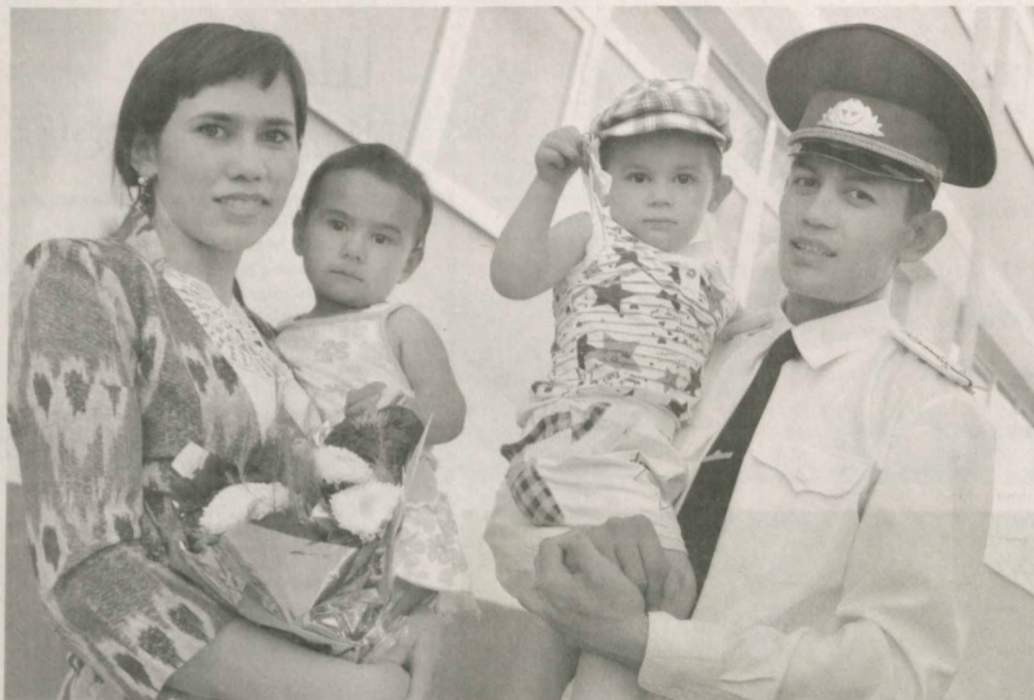
■ Накануне самого великого, самого дорогого праздника - 22-летия независимости нашей Родины группе военнослужащих Ташкентского военного округа вручены ключи от новых квартир.

Под руководством Президента Ислама Каримова в нашей стране проводится огромная работа по социальной защите населения, в частности военнослужащих и членов их семей, строительству военных городков на основе современных проектов, созданию благоприятных социально-бытовых условий и инфраструктуры, отвечающих самым высоким требованиям.