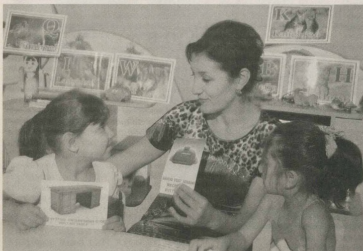
В Кашкадарьинской области проводится последовательная работа в свете исполнения постановления Президента Ислама Каримова от 10 декабря 2012 года "О мерах по дальнейшему совершенствованию системы изучения иностранных языков".