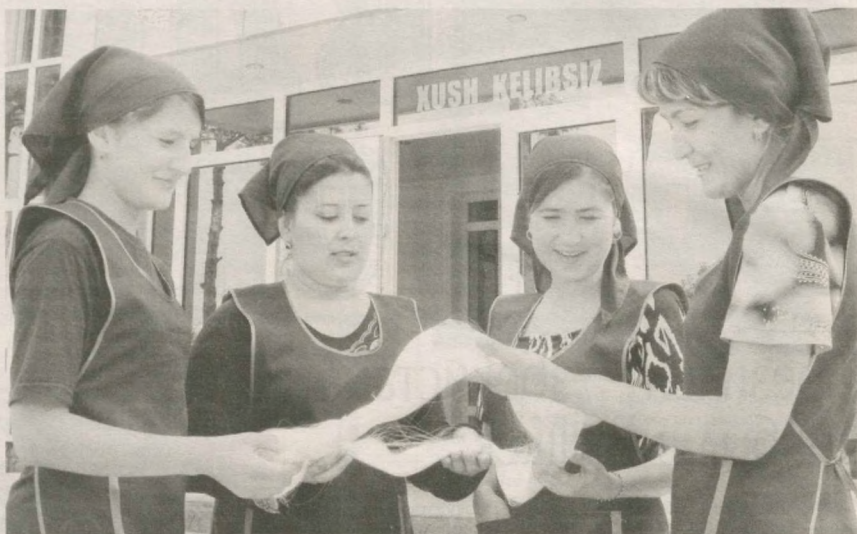
Ориентир на экспорт держит коллектив предприятия "Surxon-Termiz-Silk", где перерабатываются шелковичные коконы.