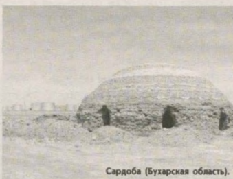
Сардоба (Бухарская область).

И наконец, третья главная отличительная черта каршинской сардобы - это высокий купол, он был намного выше, чем выпуклые купола других подобных сооружений. За прошедшие пять веков уникальный купол неоднократно разрушался, и хотя его регулярно ремонтировали, восстановительные работы не могли не изменить внешний вид сардобы. В про-