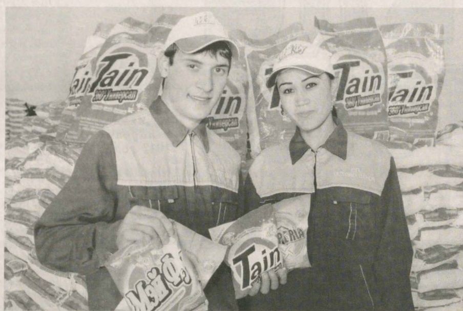
На узбекско-китайском совместном предприятии "Бухоро-Бахор", действующем в Вабкентском районе Бухарской области, на основе современных технологий производится 30 видов стирального порошка из местного сырья.

На предприятии, способном производить 70-80 тонн