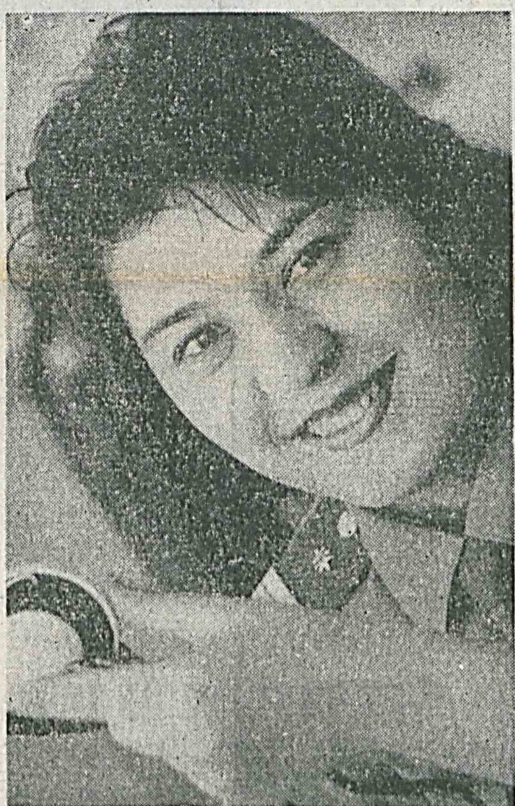
Узбекистон — Ватаним Менинг!

В Доме приемов Министерства иностранных дел республики 7 марта было подписано коммюнике по консультативному вопросу между Республикой Узбекистан и Соединенными Штатами Америки. Документ подписали министр иностранных дел Узбекистана Абдулазиз Комилов и главный координатор