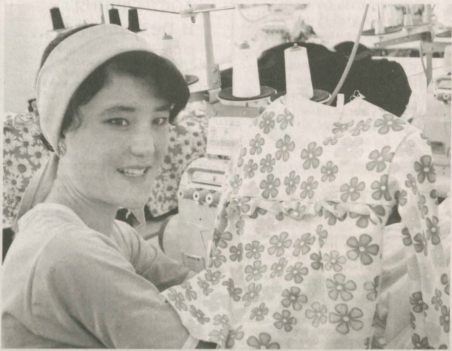
В Коканде начало работу новое текстильное предприятие "Барака фанз имплекстекстиль". На работу приняты 66 человек, большинство из которых выпускники колледжа. Они успешно трудятся над пошивом более 40 видов трикотажной одежды для женщин и детей. Ежемесячный объем производства достигнет

10-15 миллионов сумов. Сейчас фирма планирует расширение производства, за счет чего будет создано дополнительно 40 рабочих мест. Ассортимент выпускаемой продукции доведут до 55-60 наименований.