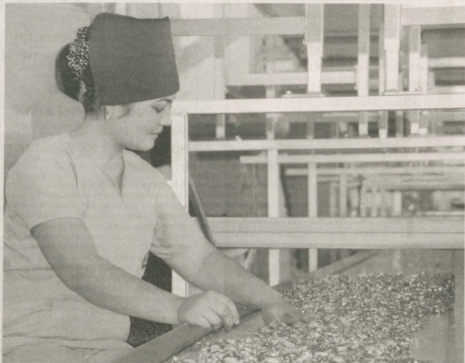
Национальный банк внешнеэкономической деятельности Республики Узбекистан вложил инвестиции в размере 10 миллиардов сумов в финансовое оздоровление действующей в Кувинском районе Ферганской области крупной кондитерской фабрики.

Средства были направлены на ремонт предприятия, строительство дополнительных помещений, модернизацию производства, а также закупку современного оборудования. Сегодня ООО "Кува кандолатлари" выпускает около двадцати видов кондитерских изделий.