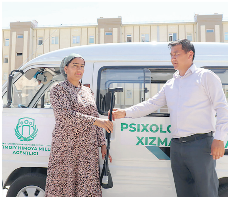
Аҳолининг кам таъминланган, ишсиз, жисмоний имконияти чекланган қатлами тегишли ёрдам ва хизматларға кўпроқ эҳтиёж сезади. Тadbир доирасида 180 нафардан ортқк муурожаатчиға бепул психологик ва юридик хизмат кўрсатилди.

Бундай учрашув ва тadbирлар халқни ўйлантираётган масалаларни хал қилишдан ташқари, уларнинг олиб борилаётган ислохотлар самарасини ўз ҳаётида ҳис қилиши учун бир восита сифатида хизмат қилади.