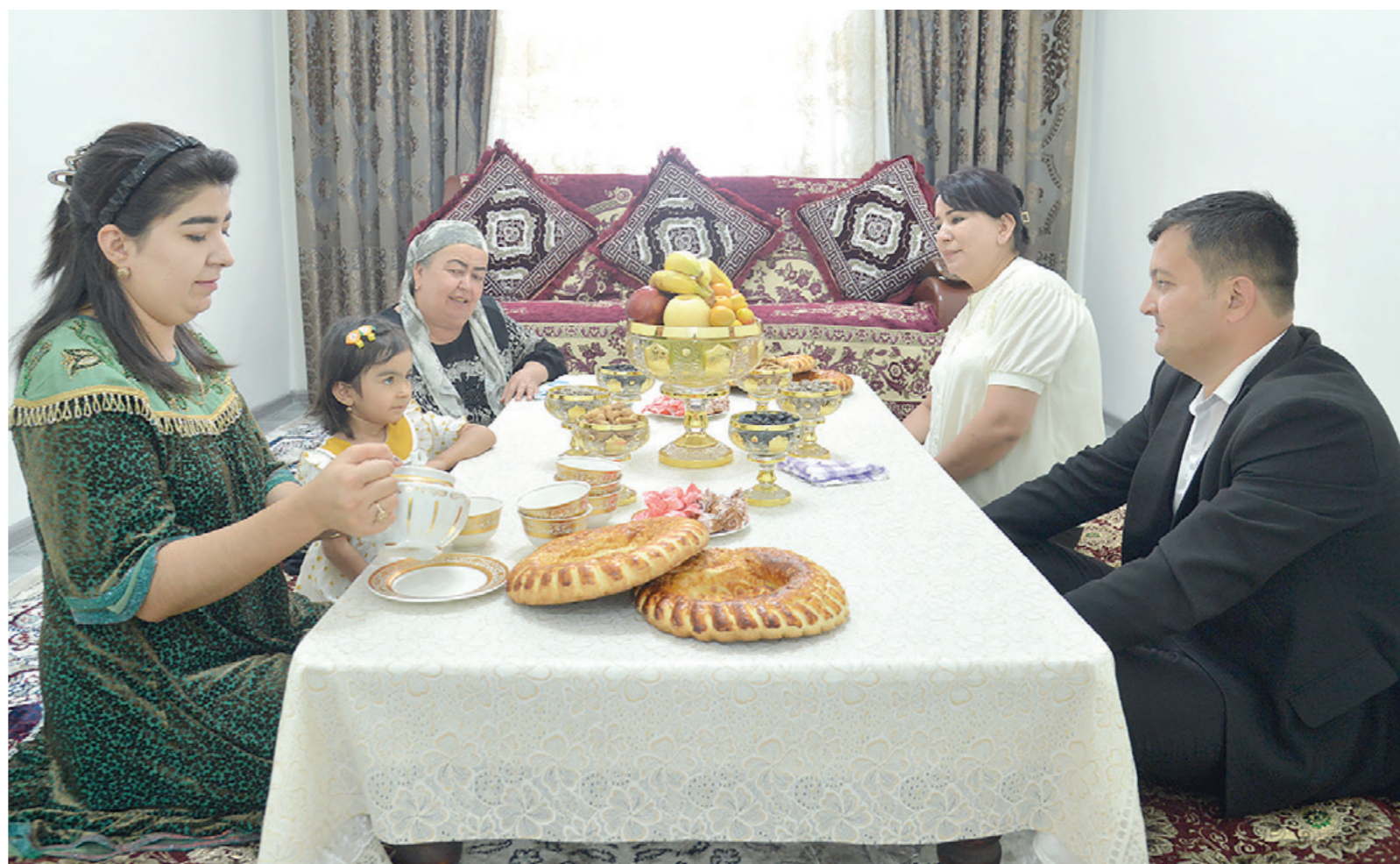
Давоми. Бошланиши 1-саҳифада.

Семинар "Ўлчо" маҳалласида "Кадриятлар – маънавий камолот мактаби" мавзусидаги маънавий-маърифий тadbирлар билан якунланди.