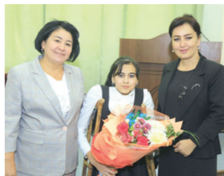
“ИЖТИМОЙ КАРТА” ТИЗИМИ ЖОРИЙ ЭТИЛАДИ

Вазирлар Маҳкамасининг “Темир дафтар” орқали ижтимоий хизмат ва ёрдам кўрсатиш ҳамда “Саховат ва кўмак” жамғармаси маблағларини шакллантириш ва улардан фойдаланиш тартибини такомиллаштириш тўғрисида”ги қарори қабул қилинди.