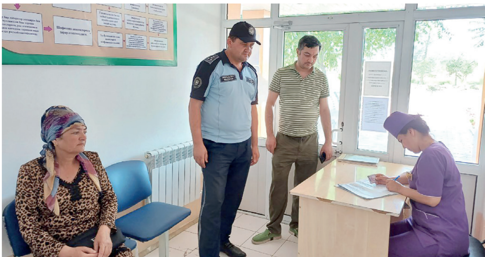
Бугун олиб борган турли саъй-ҳаракатларимиз натижасида “яшил” тоифага ўтдик. Албатта, уни ушлаб туриш энг катта масала. Воёга етмаганлар ва ёшлар билан ишлашда муаммо йўқ.

“Ватан” – Ватан ичидаги мўъжазгина маскан. Ушбу маҳаллада саккиз мингдан ортиқ турли миллат вакиллари аҳилиқда ҳаёт кечирмоқда. Бироқ катта оиланинг ташвишлари ҳам катта бўлади деганларидек, маҳалламизнинг ўзига яраша ташвишлари бор.