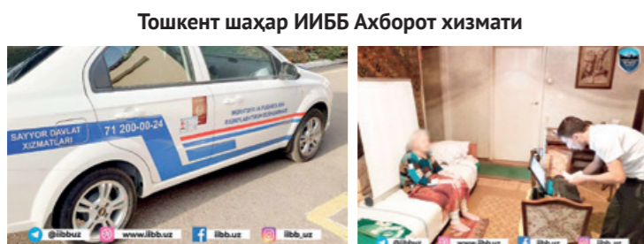
Тошкент шаҳар ИИББ Ахборот хизмати

паспортни алмаштириш масаласида лоқайд бўлмастикларини, бу ишни зиммасига олиб, беморнинг яшаш манзилидаги Миграция ва фуқароликни расмийлаштириш бўлимига мурожаат қилишларини сўраб қоламан. Эслатиб ўтаман, мазкур жараён дарҳол амалга оширилмади, бу иш туман бўйича мурожаатлар тушишига қараб (маълум вақт ичида) бажарилади. Яна бир эслатма! Вазият тезкорлиқни талаб қилган ҳолатларда ходимнинг уйга ташифининг бошқа бир тури – экспресс-хизмат кўрсатиш йўлга қўйилган. Бу хизматдан исталган фуқаро фойдаланиши мумкин. Сайёр хизматдан фойдаланиш учун стандарт йиғим ва тўловлардан ташқари, БҲМ 21,9 фоиздан (агар масофа 10 км. атрофида бўлса) 83,2 фоизгача (100 км.) ташкил этувчи транспорт харажатлари тўланиши лозим. Экспресс-хизматга буюртма беришни 71-200-00-24 Call-маркази орқали амалга ошириш мумкин. Буюртмани расмийлаштиришда ID-картага манзилни ўзгартиришда, тиббий муассасаларга, даволаш масканларига жойлаштиришда ёки қайғули ҳолат – вафотини қайд этиш ҳолатларида жуда зарур бўлади.