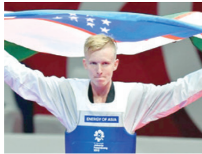
Ўзбекистон таэквондо WT ассоциацияси илк маротаба БЕШ НАФАР СПОРТЧИ билан Олимпия ўйинларида қатнашади.