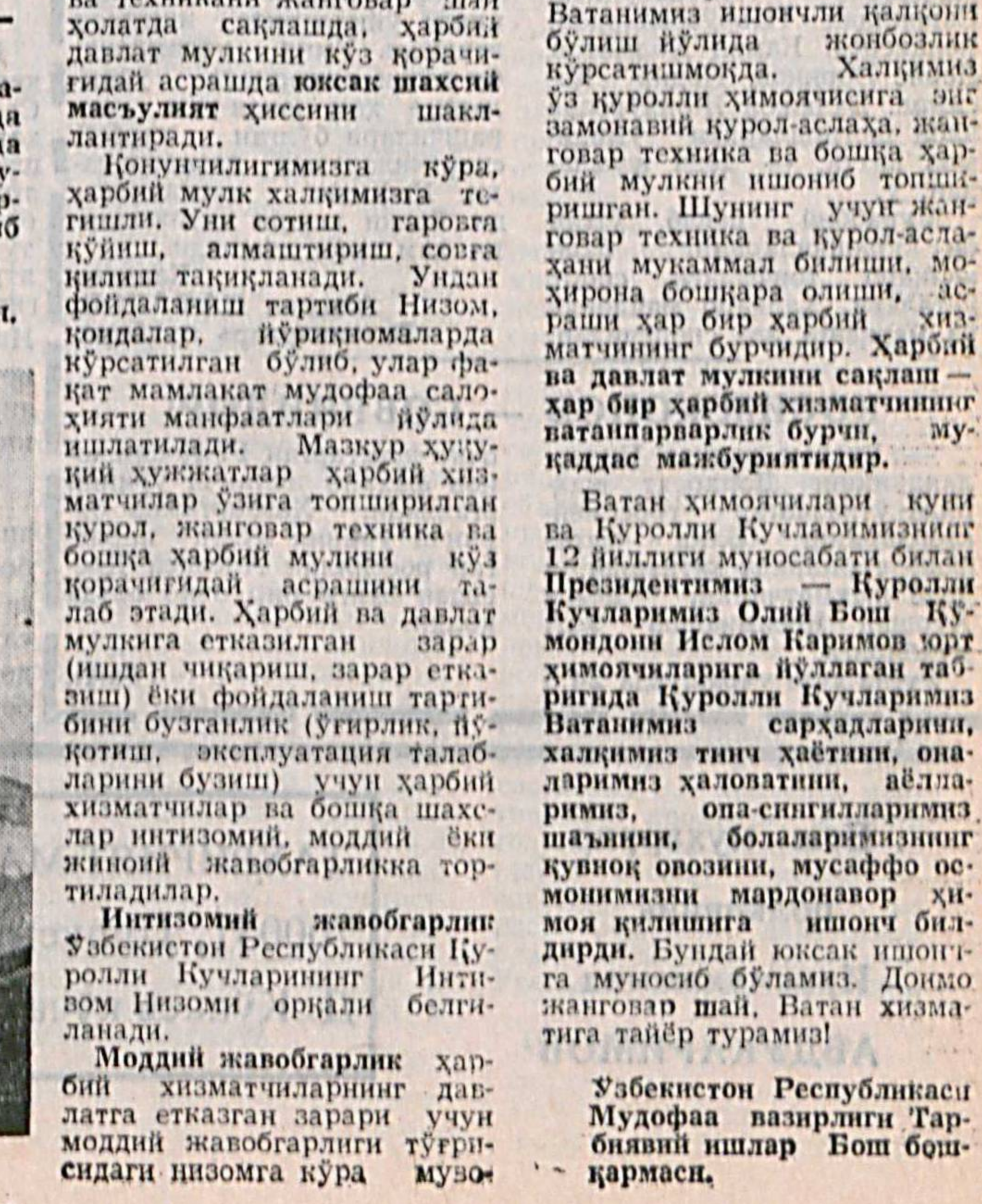
Ҳарбий хизматчининг бурни...